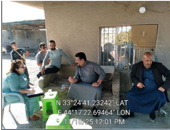
المجتمع المحلي ومستخدمو الأراضي في قرية الصابيات